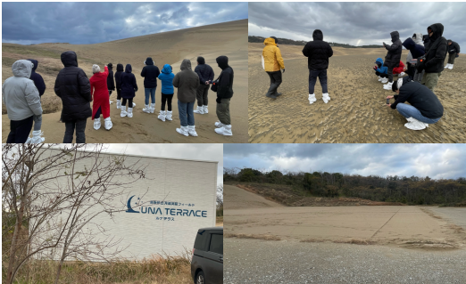
図3: フィールドトリップの様子(上段:鳥取砂丘, 下段:ルナテラス).